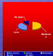
Tratamiento en sala

Al finalizar el tratamiento procedemos a evaluar los resultados.